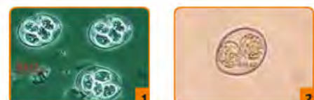
1 Oocisti di Eimeria; 2 Oocisti di Isospora.

NOTE: COXIVET 10% è attualmente l'unico prodotto specifico per la coccidiosi dei volatili contenente Amprolium.