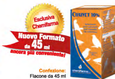
Confezione: Flacone da 45 ml